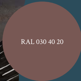
RAL 030 40 20