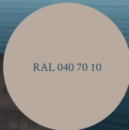
RAL 040 70 10