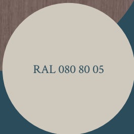
RAL 080 80 05