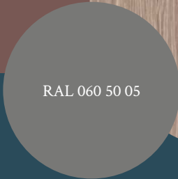
RAL 060 50 05